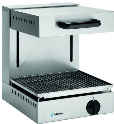
Cocción y Hornos - Salamandras - Salamandras Eléctricas con techo móvil