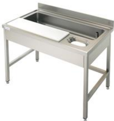
Preparación estática - Fregaderos industriales - Fregaderos especiales