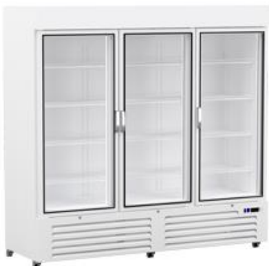
Frio Comercial - Armarios expositores - Armarios expositores Minimarket